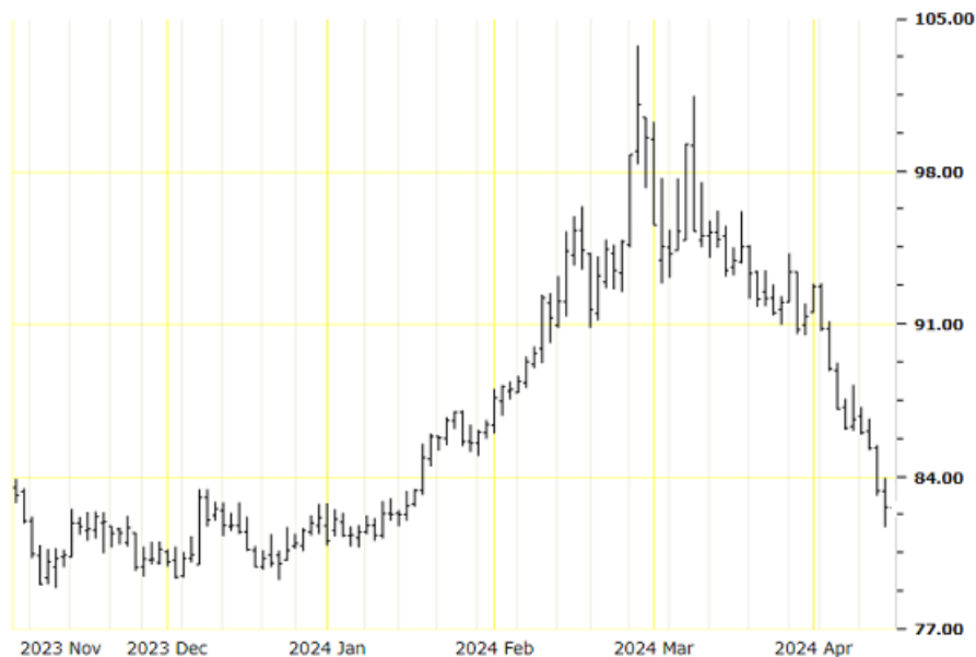
BORSA DEL COTONE DI NEW YORK - Chiusura del 12 aprile 2024 - Posizione MAGGIO 2024

A meno di due settimane di distanza dal "primo giorno di consegna" della posizione di maggio, il contratto di luglio inizierà a diventare quello principale circa le posizioni a breve termine.